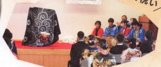
下駒沢氏子保存会