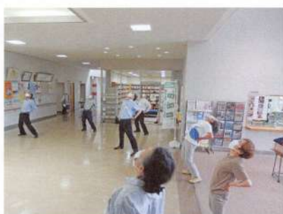
元気ハツラツ体操