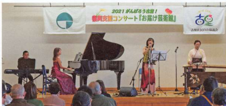
「お届け芸術館」のプロの演奏家2組4名

住民の皆様の記憶が年月の経過とともに薄れていく中、災害はいつ発生するか分かりませんので、災害時に的確な対応が行えるよう改めてその重要性を再確認したところです。