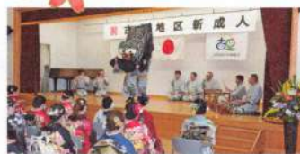
上駒沢祭典保存会

令和4年の新春1月2日(日)古里総合市民センターにて、古里地区成人祝賀式が新型コロナウイルス感染拡大の影響で延期されていた令和2年度と、今年の令和3年度がそれぞれ開催されました。