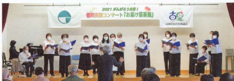
地元のコーラスグループ「ふるさとハーモニー」