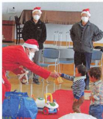
クリスマス会 (12月20日)

広い室内に親子で集まって、一緒に遊んだりおしゃべりをしたりして楽しいひと時を過ごして、仲間づくりをしています。