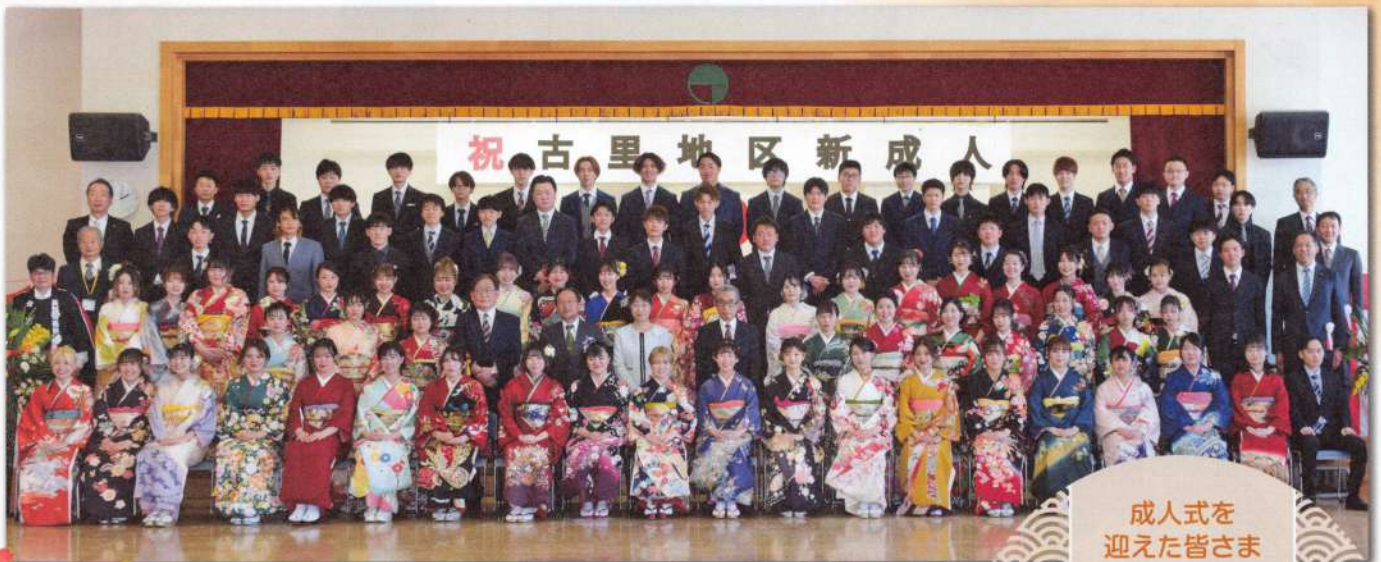
令和3年度 古里地区新成人