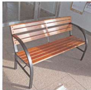
ひと休みできるベンチを各区に配布

月1回、20分程度の短時間ではありますが、みんなで体を動かし、心と体をほぐしていただければと思います。