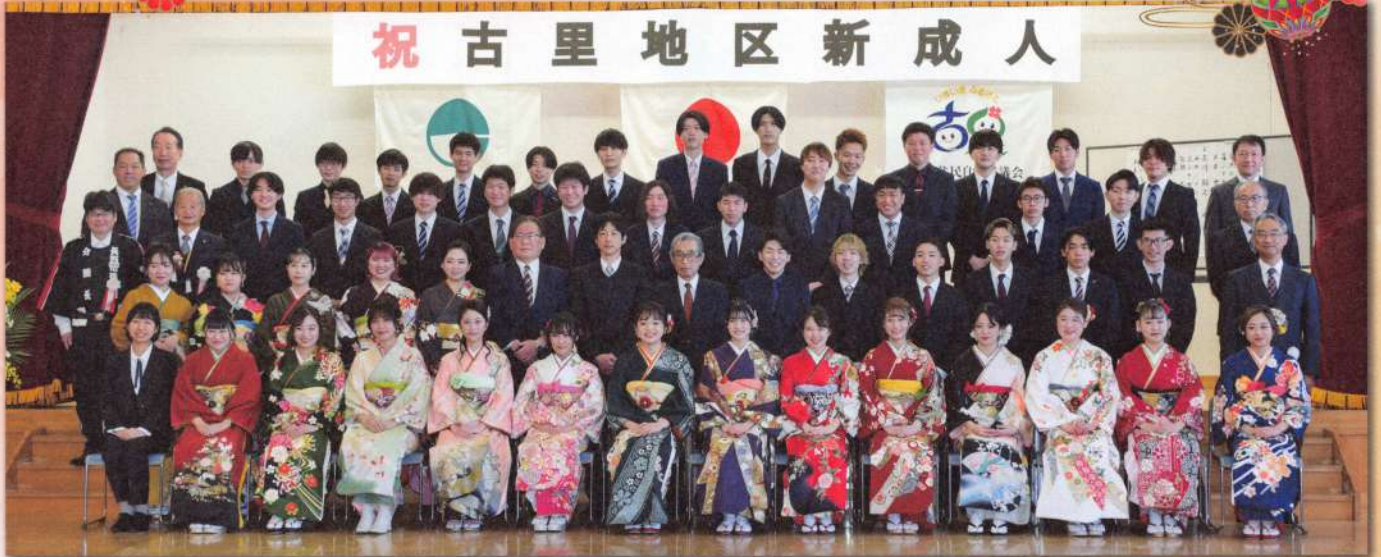
令和2年度 古里地区新成人